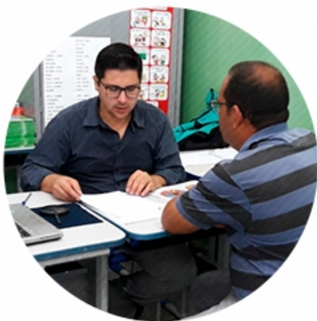
CAMPO LIMPO PAULISTA São Paulo (2018)

Uma comunidade saudável é um alicerce para uma sociedade mais forte e feliz! Com a experiência adquirida na prática terapêutica, ministro palestras em várias localidades do Brasil para comunidades carentes, associações de moradores, workshops, missões, iniciativas de combate à fome e empresas de diversas áreas, falando da importância da qualidade de vida nas práticas diárias pessoal, profissional e em sociedade. Vamos continuar trabalhando juntos, cultivando um ambiente, onde todos possam acessar informações sobre a importância da nutrição, e fazer escolha certa por alimentos saudáveis.