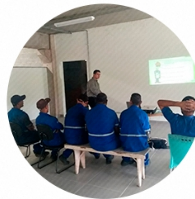
PALESTRA Carapicuíba/SP (2019)