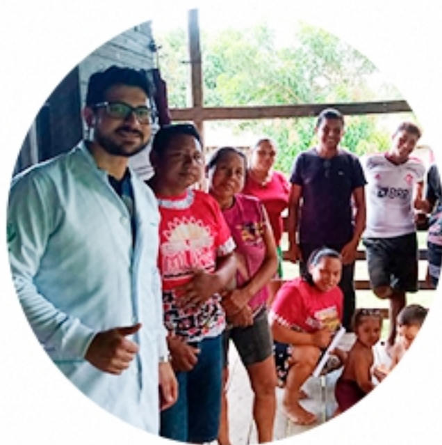
COMUNIDADE INDÍGENA Manaus (2023)