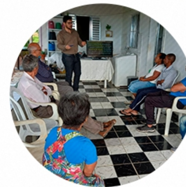
PALESTRA Bofete/SP (2021)