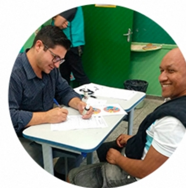
SÃO VICENTE São Paulo (2020)