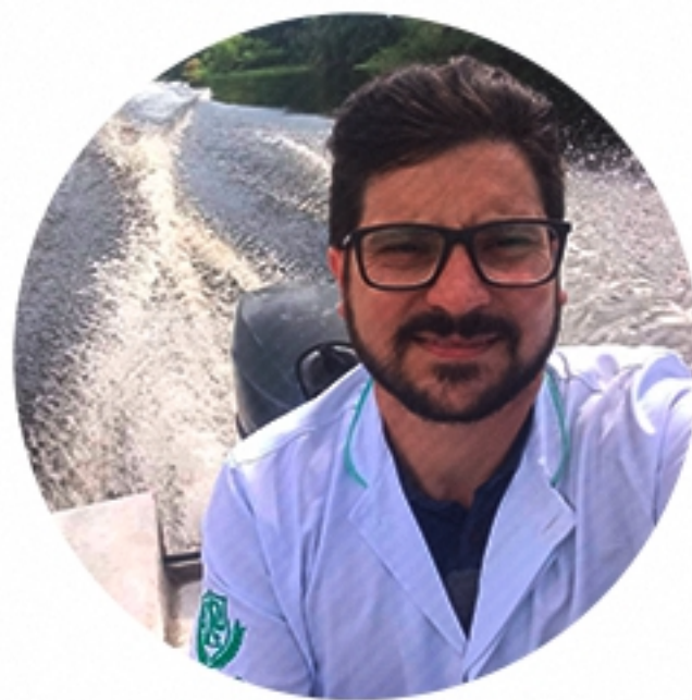
COMUNIDADE SANTA LUZIA Manaus (2023)