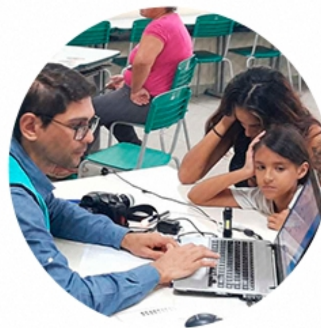
ITAPETININGA São Paulo (2022)