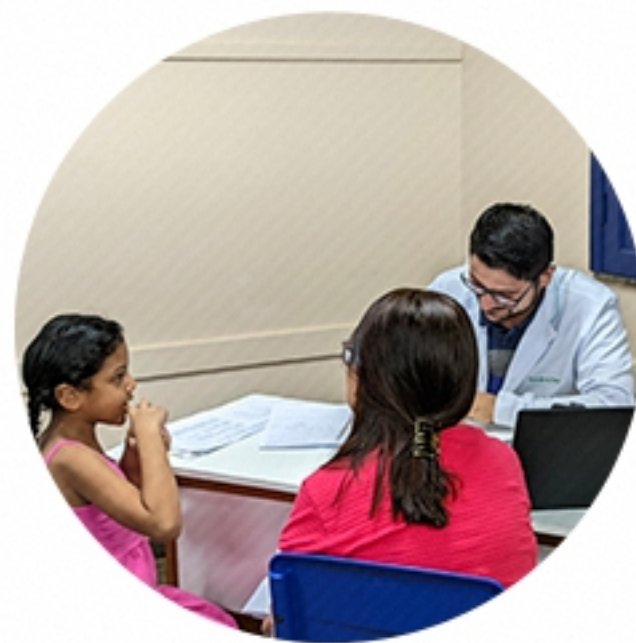
SOROCABA São Paulo (2022)